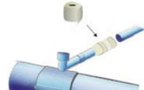
Etanchéifier le tuyau à l'aide d'une bande d'isolation. Rohr mit Isolierbinde abdichten